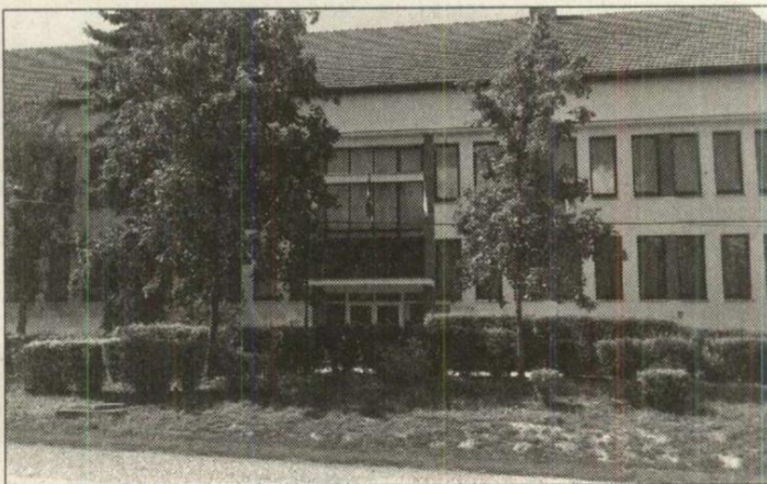
A bácskossuthfalvi Id. Kovács Gyula Általános Iskola

– A közelmúltban sikeresen szerepeltünk a Magyar Nemzeti Tanács egyik pályázati kiírásán, aminek köszönhetően bútorvásárlásra kaptunk támogatást. Emellett a