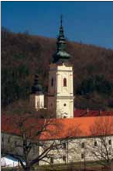
18. Manastir Jazak