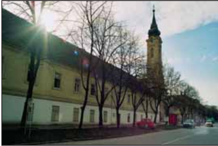
34. Franjevačka gimnazija u Rumi