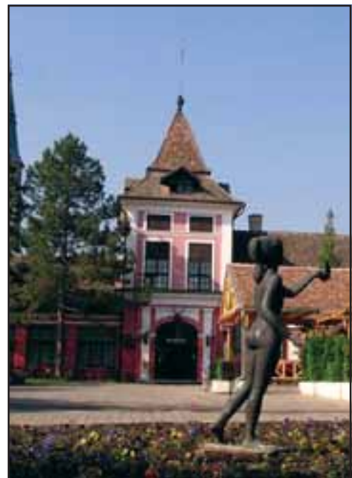
61. Dvorac (Kaštel) Lazarovich u Ečki