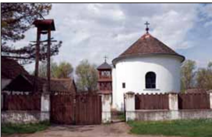
10. Crkva Sv. Luke u Kupinovu