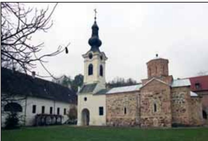
23. Manastir Mesić