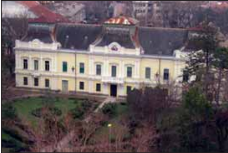
24. Episkopski dvor u Vršču