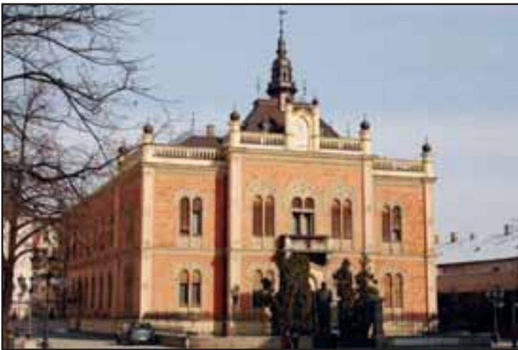
48. Vladičanski dvor u Novom Sadu