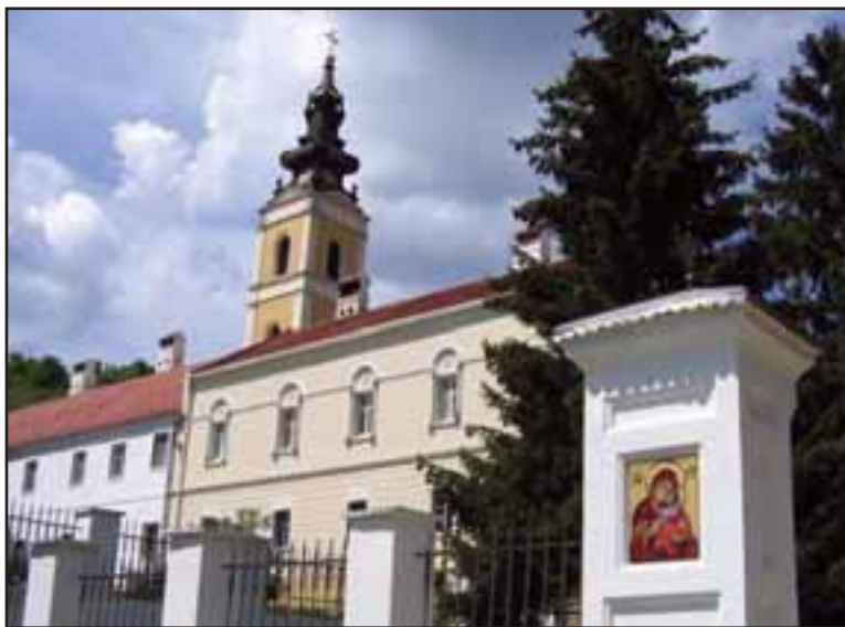
15. Manastir Grgeteg