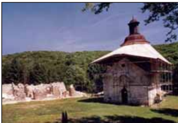
16. Manastir Staro Hopovo