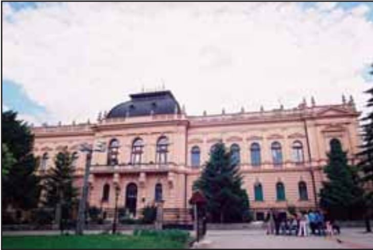
28. Patrijaršijski dvor u Sremskim Karlovcima