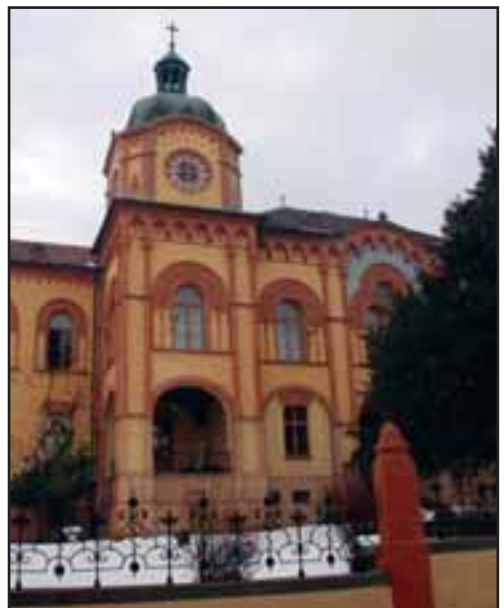
29. Karlovačka gimnazija