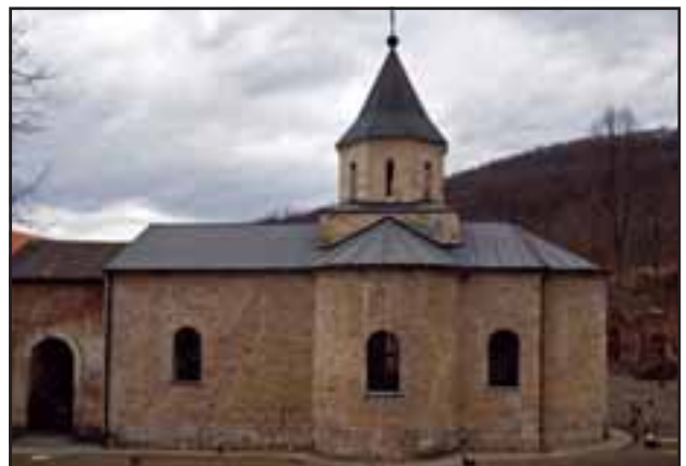
17. Manastir Rakovac