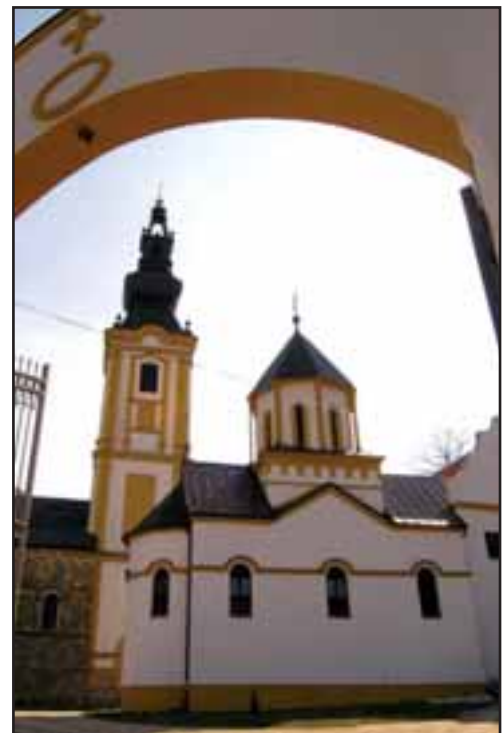
22. Manastir Privina glava