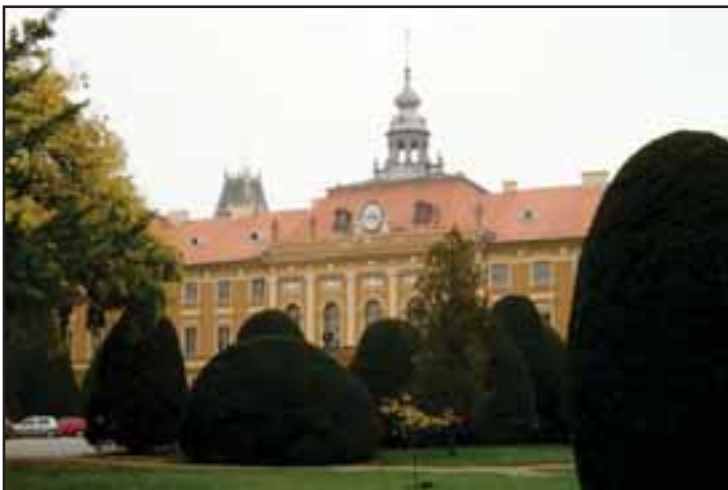
26. Zgrada županije u Somboru