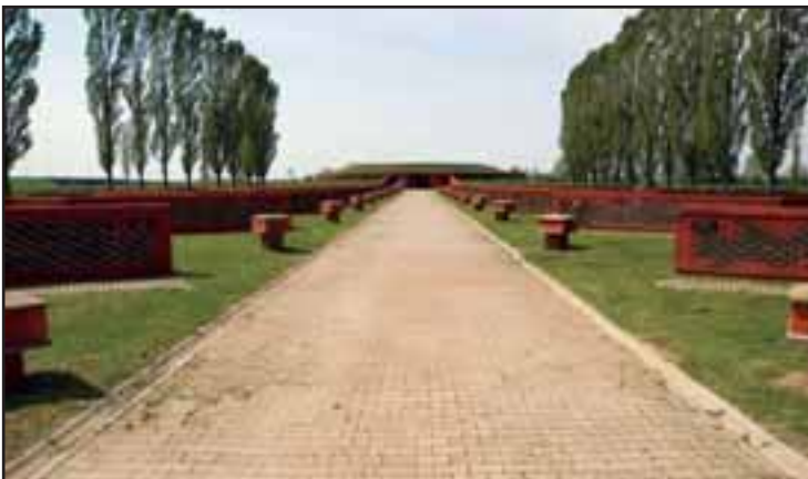
9. Spomen obeležje Sremski front