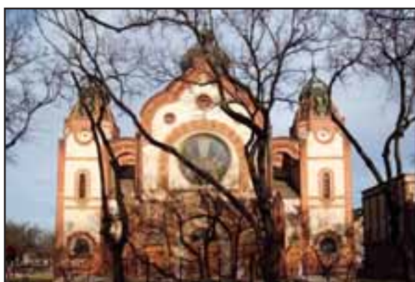
45. Sinagoga u Subotici