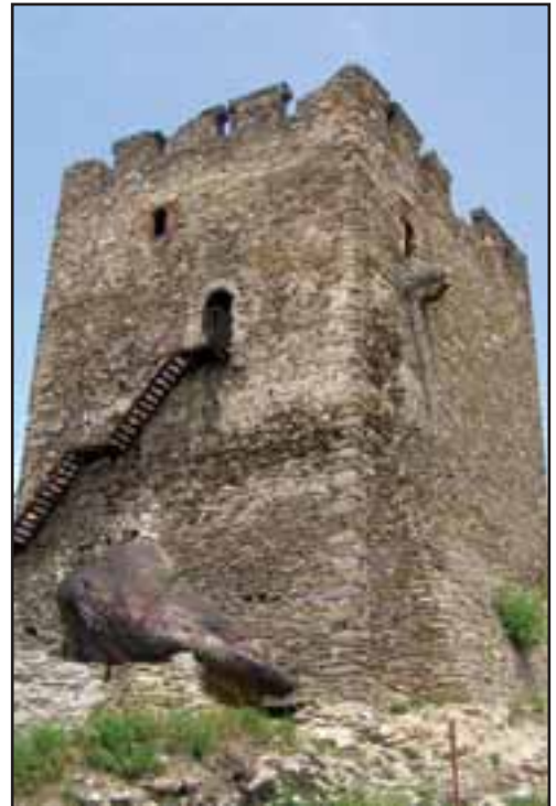
25. Vršačka kula