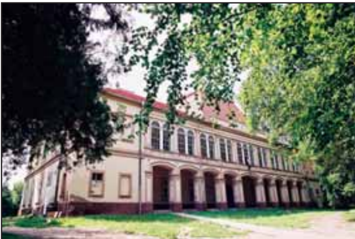
31. Dvorac Servijskih u Novom Kneževcu