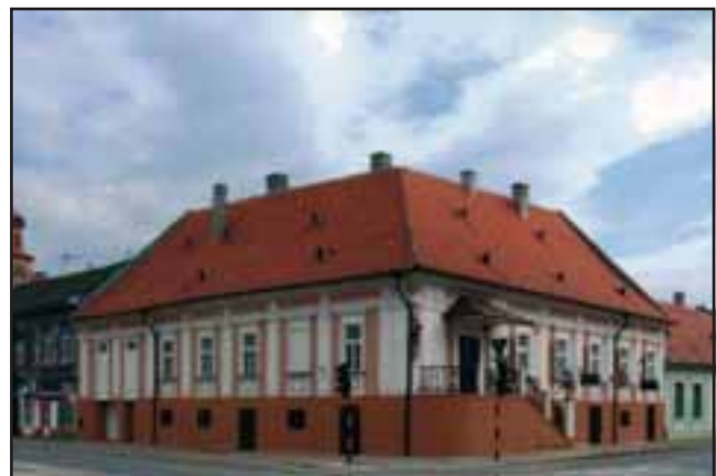
42. Stara apoteka u Vršcu