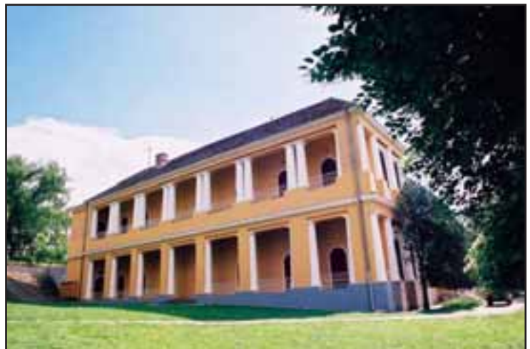
56. Dvorac Marcibanjijevih u Sremskoj Kamenici