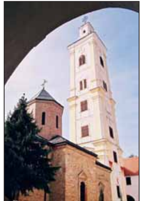
14. Manastir Velika Remeta