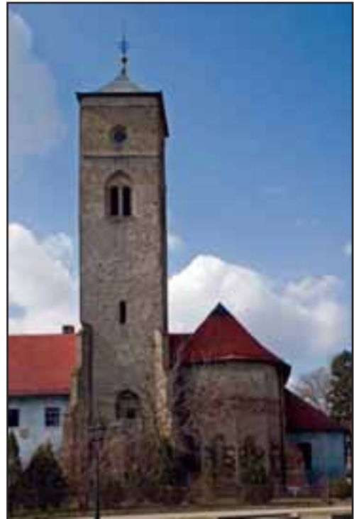
59. Franjevački samostan u Baču