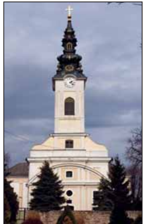
5. Grkokatolička crkva u Ruskom Krsturu