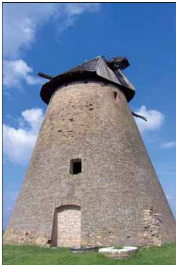
44. Vetrenjača u Melencima