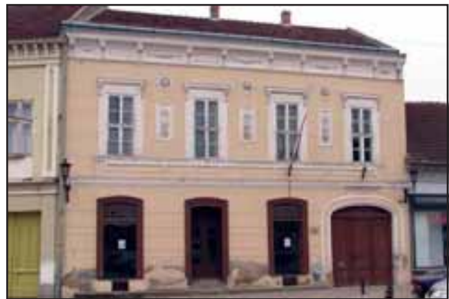
41. Kuća Jovana Sterije Popovića u Vršcu