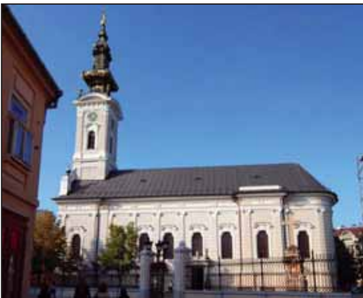
49. Saborna crkva Sv. Đorđa u Novom Sadu