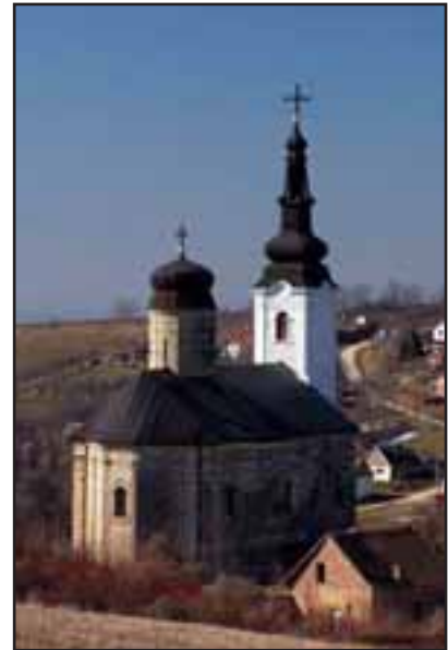
20. Manastir Šišatovac