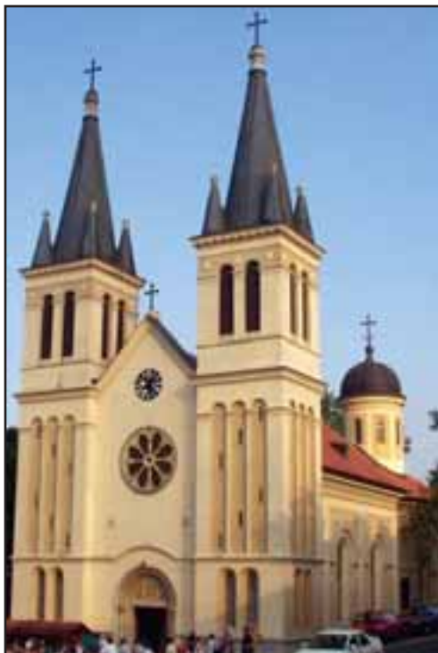
53. Crkva Marije Snežne u Petrovaradinu