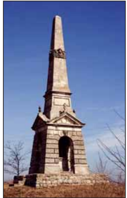
2. Spomenik posvećen bici kod Slankamena