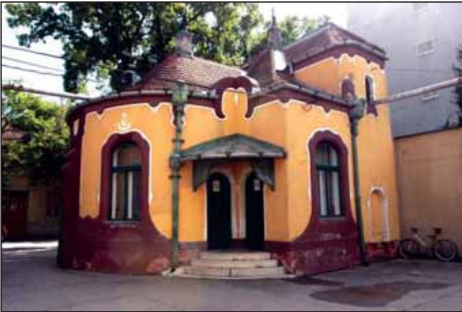
39. Vatrogasni dom u Senti