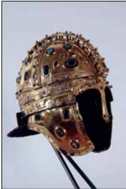
12. Rimski šlem iz Berkasova