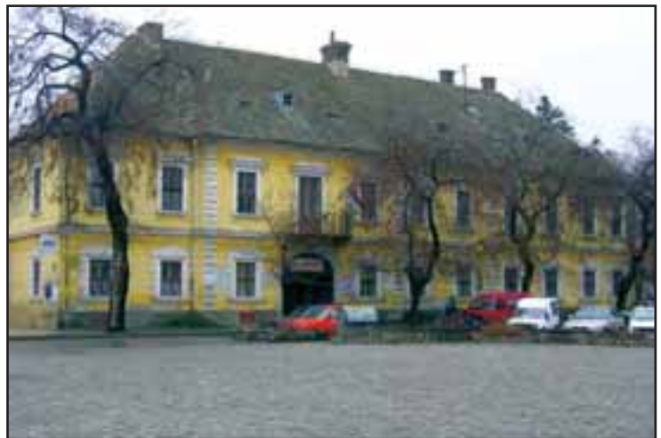
37. Grašalkovićeve palata u Somboru