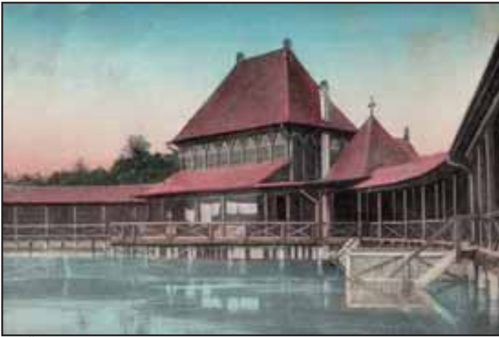
47. Žensko kupalište na Paliću