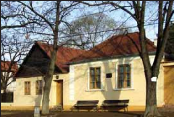
57. Kuća Jovana Jovanovića Zmaja u Sremskoj Kamenici