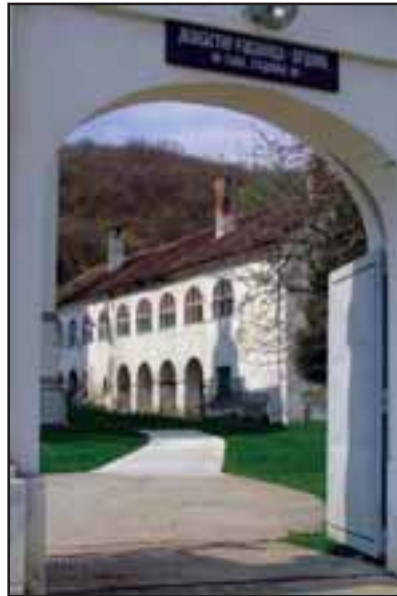
19. Manastir Vrdnik