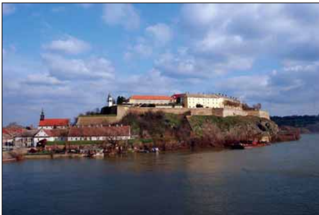
46. Petrovaradinska tvrđava