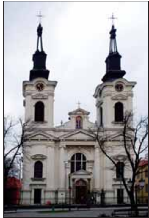
30. Saborna crkva u Sremskim Karlovcima