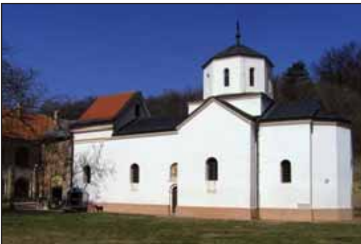
21. Manastir Đipša