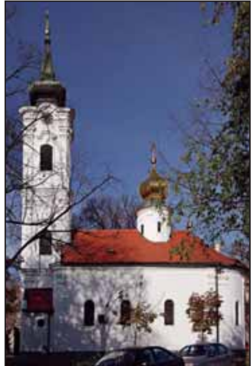
51. Nikolajevska crkva u Novom Sadu