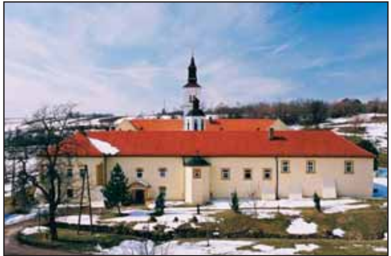
13. Manastir Krušedol