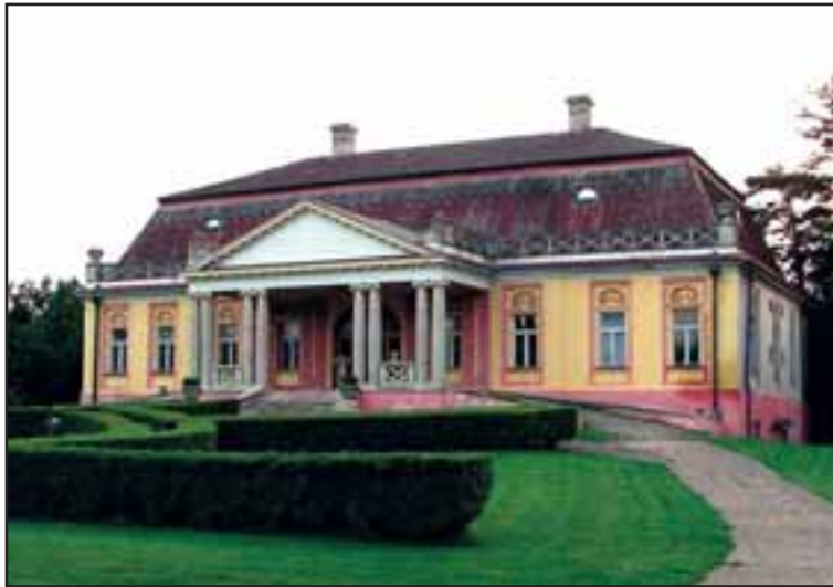
1. Dvorac Stratimirovića u Kulpinu