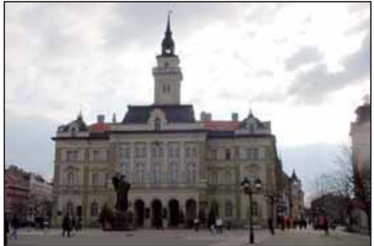
54. Gradska kuća u Novom Sadu