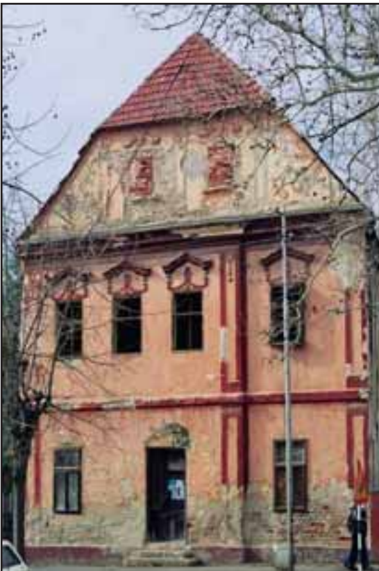
40. Vatrogasni dom u Beloj Crkvi