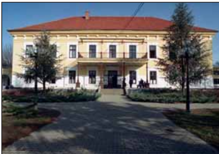
4. Dvorac grofa Hadika u Futogu