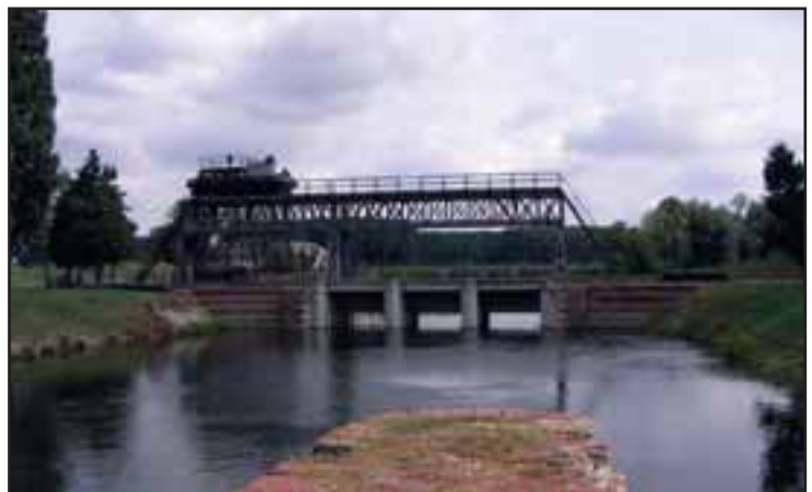
38. Prevodnica "Šlajz" kod Bečeja