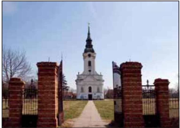
7. Rumunska pravoslavna crkva u Uzdinu