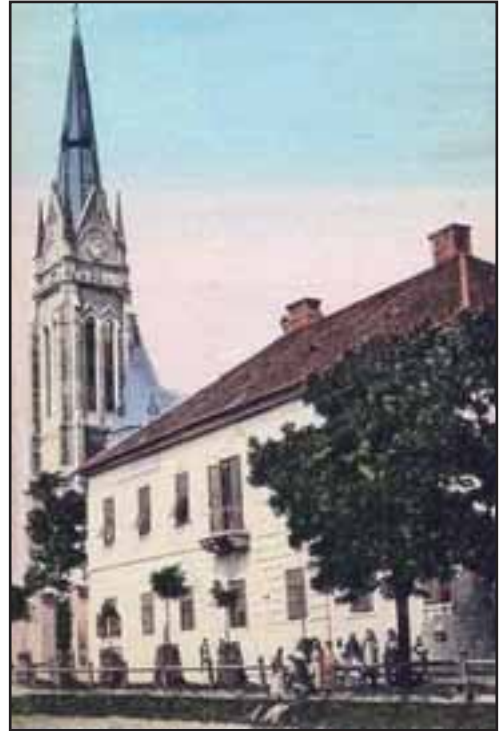
35. Kaštel Kraj u Bačkoj Topoli