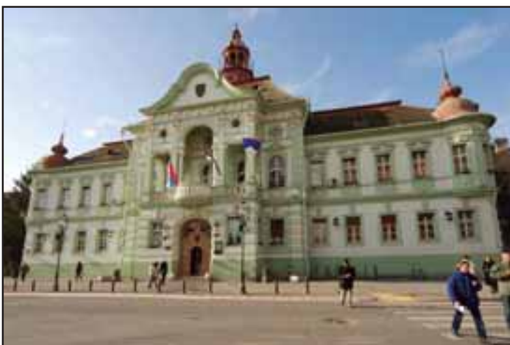
27. Zgrada županije u Zrenjaninu