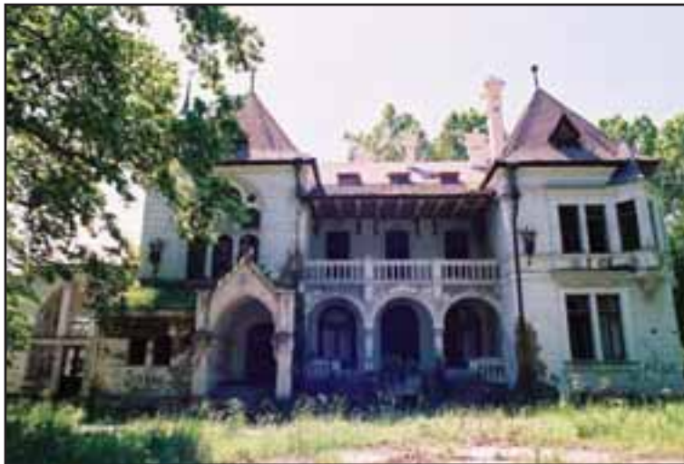
3. Dvorac Špicerovih u Beočinu