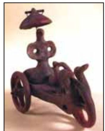
11. Arheološko naselje Grad u Dupljaji