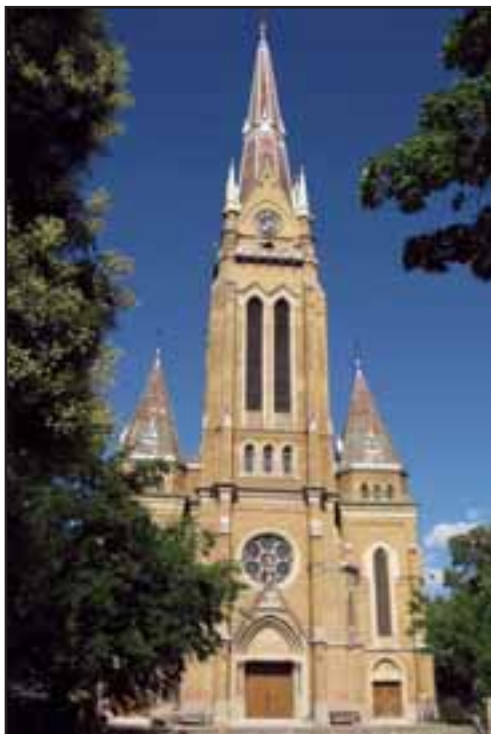
36. Neogotička crkva u Bačkoj Topoli