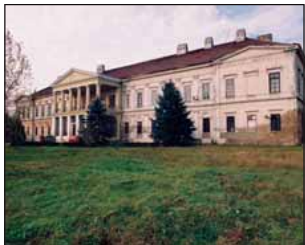
33. Dvorac Karačonji u Novom Miloševu