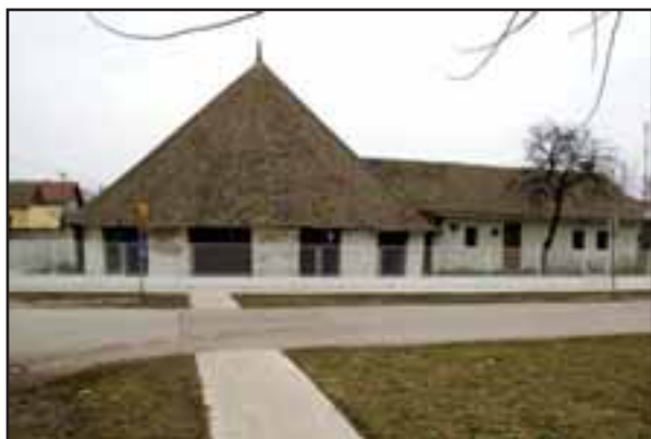
43. Suvača u Kikindi