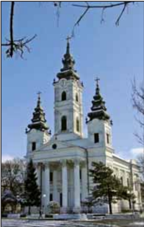
6. Srpska pravoslavna crkva Sv. Đorđe u Bečeju