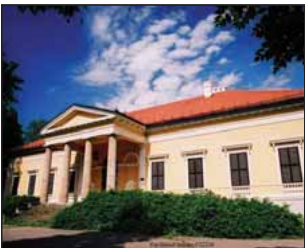
32. Dvorac Dunđerskih u Čelarevu