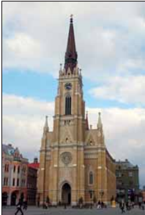
52. Crkva Imena Marijinog u Novom Sadu