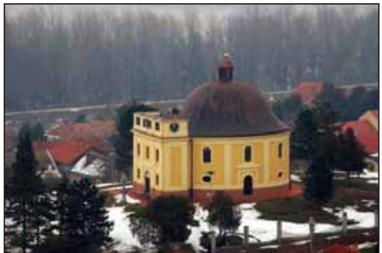
55. Kapela mira u Sremskim Karlovcima