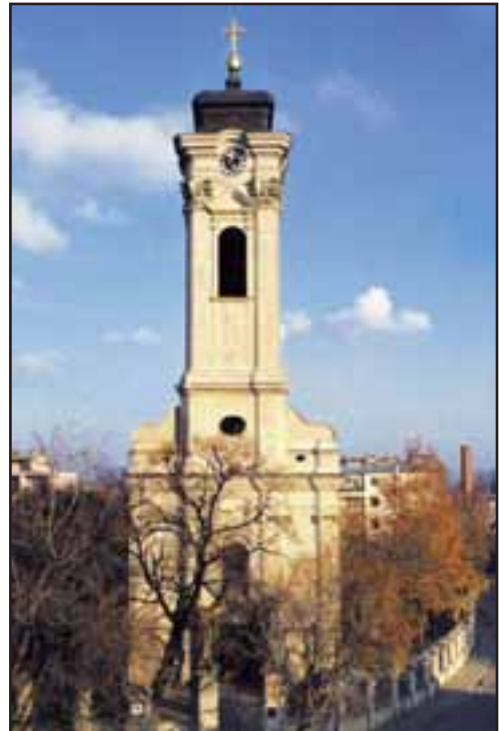
50. Almaška crkva (hram Sv. Tri jerarha) u Novom Sadu