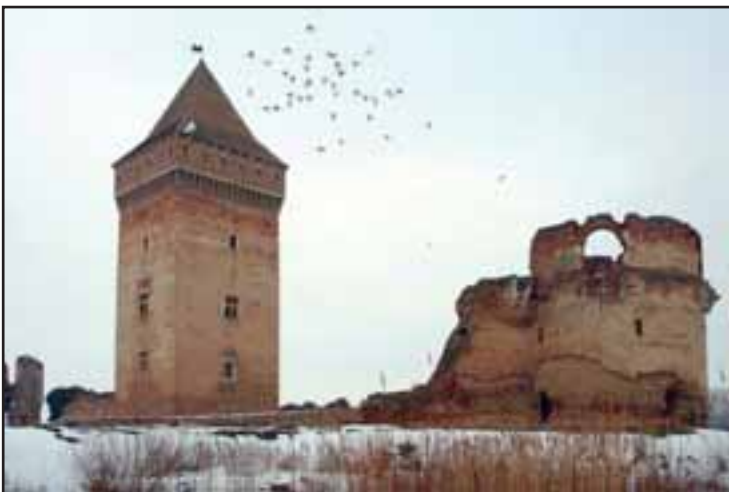
58. Tvrđava u Baču