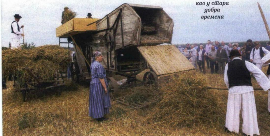
Вршидба као у сџара добра времена

Манифестацију су помогли и Министарство културе и информисања као и Министарство државне управе и локалне самоуправе Републике Србије, затим Покрајински секретаријат за културу, јавно информисање и односе са верским заједницама, Покрајински секретаријат за образовање, прописе, управу и националне заједнице, Покрајински секретаријат за пољопривреду, водопривреду и шумарство, град Суботица, Завод за културу војвођанских Хрвата, Средишњи државни уред за Хрвате изван Републике Хрватске, Хрватско национално веће и многобројни спонзори. Завршној свечаности овогодишње Дужијанце присуствовали су представници дипломатског кора, јавног и политичког живота Републике Србије, Војводине и Суботице као и представници Европске уније. ■